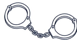
کسی که می‌شناسم دستگیر شده است