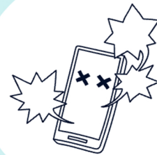
دستگاه من مشکوک عمل می‌کند