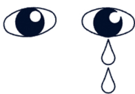
در فضای مجازی مورد آزار و اذیت قرار گرفته‌ام