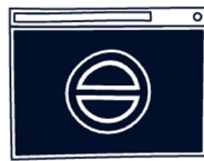
وب‌سایت من کار نمی‌کند