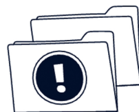
من اطلاعاتم را گم کردم