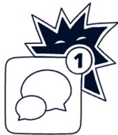
پیام‌های مشکوکی دریافت کرده‌ام