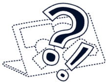
دستگاهم را گم کردم

بسته «کمک‌های اولیه دیجیتال» منبعی رایگان برای کمک به مربیان امنیت دیجیتال و فعالان فن‌آوری است تا از خود و جوامعی که از آن‌ها حمایت می‌کنند، محافظت بهتری داشته باشند. همچنین می‌تواند توسط فعالان، مدافعان حقوق بشر، وبلاگ‌نویسان، روزنامه‌نگاران یا فعالان رسانه‌ای که می‌خواهند درباره نحوه محافظت از خود و حمایت از دیگران بیشتر بدانند، استفاده شود. اگر شما یا شخصی که به او کمک می‌کنید یک موقعیت اورژانسی دیجیتالی را تجربه می‌کنید، کیت کمک‌های اولیه دیجیتال شما را در تشخیص مشکلاتی که با آن روبرو هستید راهنمایی کرده و در صورت نیاز، شما را به ارائه‌دهندگان پشتیبانی ارجاع می‌دهد.